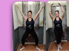
Jambes écartées puis serrées