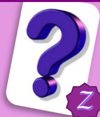
Comme tu veux