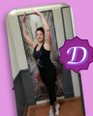
Déboulé ou développé