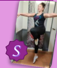
Saut ou sautillés