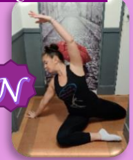
Niveau (passage au sol)