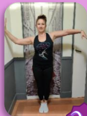
Wave (vague bras)