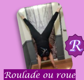
Roulade ou roue